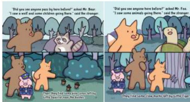
圖二、SDGs 英語繪本 The Lovely Community

此臨床教學的初衷是建立連結，將可能深奧的「議題」與學生的「生活」拉近距離，並朝向「共榮共好」的目標。如何引起學生的興趣與動機是第一步，所以使用自創的 SDGs 英語繪本故事（創作者：張佑瑄 Yu-Hsuan, Chang 繪製設計的「The Lovely Community」（圖二），主題是以 SDGs No.16（Peace, Justice and Strong Institutions），關於和平、正義及健全制度的議題，由一群小動物的失蹤與找回的故事，烘托出潛在問題，例如：貪汙、瀆職、拐賣兒童等。