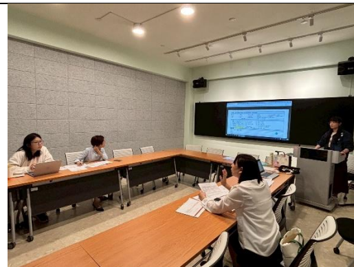
說明：計畫執行細項期程確認