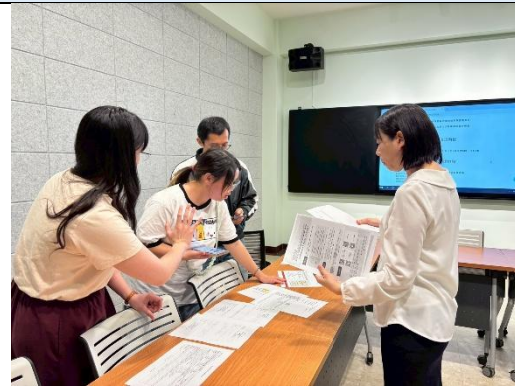
說明：說明格式規定