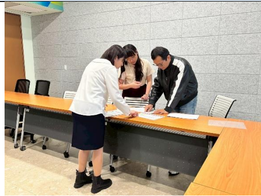
說明：表格與執行期程確認