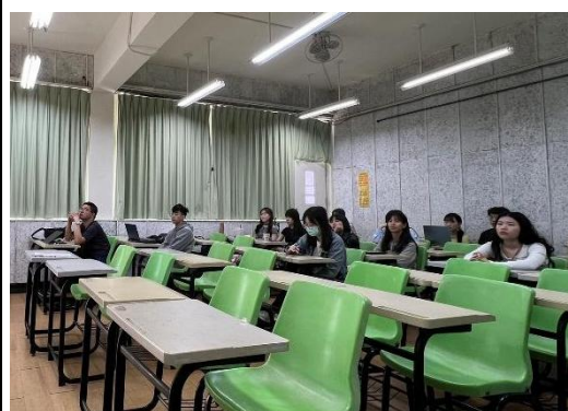
說明：同學們認真聽演講與實作