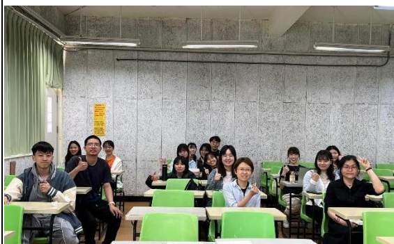
說明：與講者大合照