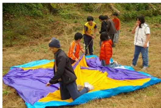
• 學生協力搭建宿營的帳篷

在反覆的對談及分享中，決定從過去「小小解說員」的目標上加以發展，以「學生是學習主體」的概念，讓學生和教師團隊一起設計課程，透過教師同儕的協同指導以及師生共同參與，增加彼此的團隊意識與合作能力；同時，再以「在生活中學習生活」的概念，安排野炊、露營、自主安排活動，讓學生以實作體驗的方式學習，加強其生活能力。透過「五動」的方式，讓學生在實際的探索體驗中，同儕共同成為兼有人文關懷、服務學習及解說知識的「小小生活家」。